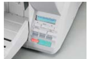
Panel de Control Intuitivo

Mediante el panel de Control Intuitivo del escáner DR-X10C, usted puede seleccionar botones programables y previamente registrados para "Digitalizar Trabajos", verificar mensajes y seleccionar la configuración del escáner. La bandeja de alimentación se abre automáticamente al activarse el escáner. El escáner DR-X10C también cuenta con un diseño ergonómico, compacto y de peso liviano lo que agrega comodidad de manejo al operador. Incluye rodillos de alimentación reemplazables por el usuario para un fácil mantenimiento.